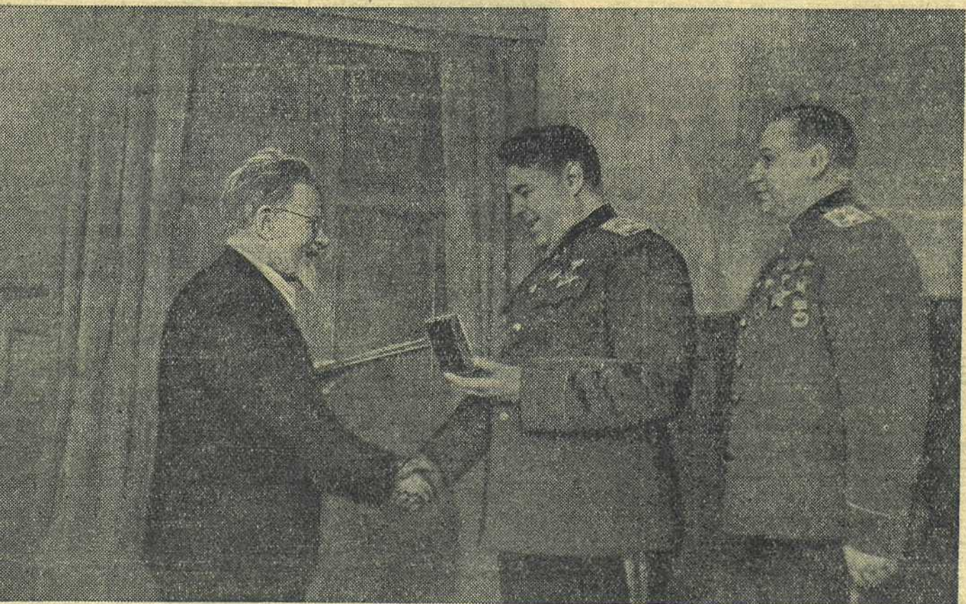
ВЧЕРА В КРЕМЛЕ. Вручение Председателем Президиума Верховного Совета СССР М. И. Калининым маршальского знака отличия — «Маршальская Звезда» маршалу Советского Союза А. М. Василевскому и маршалу артиллерии Н. Н. Воронову.

Впереди идет плавильный цех, работающий сейчас на небывало высоких скоростях. Давление в 750 миллиметров до сих пор считалось предельным. Плавильщики довели его до 1000 миллиметров. Перевыполнение суточного задания на 15—17 процентов стало повседневным.