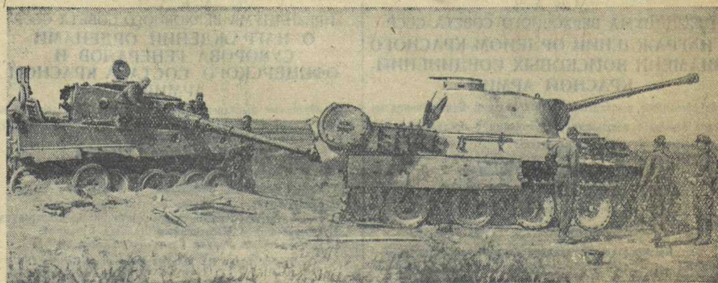
ПОЛТАВСКОЕ НАПРАВЛЕНИЕ. Немецкие тяжелые танки «тигр» и «пантера», подбитые и сожженные танкистами Н. части.